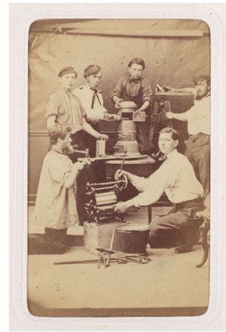
Schlüsselwerkstatt mit Lehrlingen, 1865-1870

Es wird gezeigt, wie wichtig das duale Berufsbildungssystem ist, wie es sich geschichtlich entwickelt hat und was es für die Bevölkerung in der Schweiz bedeutet. Durch die Anordnung der Fotografien in einem Wohnraum werden der Stellenwert der Berufslehre im schweizerischen Alltag und die Prägung für nachfolgende Generationen besonders hervorgehoben.