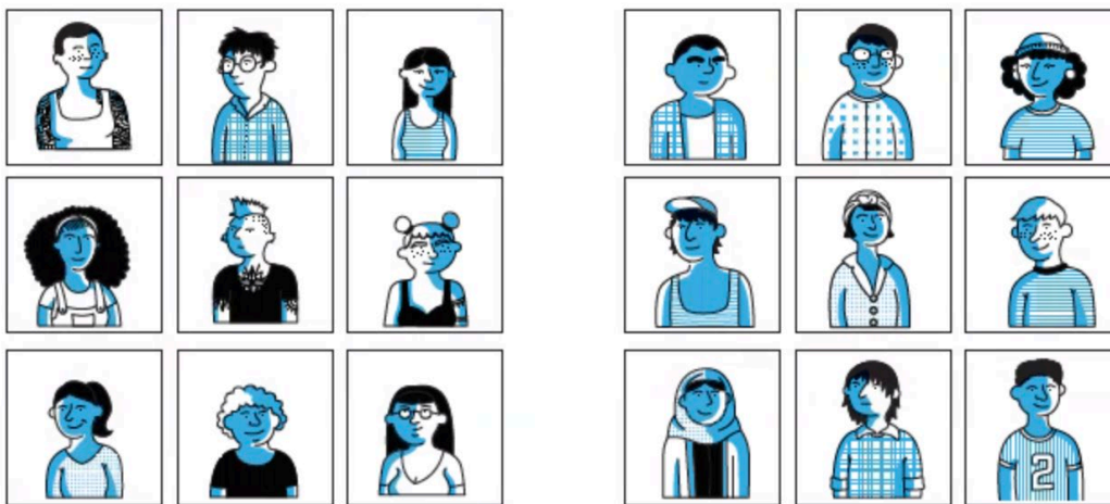
Spiel «In der Haut einer/s Einstellungsverantwortlichen», oder wie man bei einem Bewerbungsgespräch eine geeignete Kandidatin oder einen geeigneten Kandidaten findet.

Die künftigen Lernenden und der Ausbildungsbetrieb stehen vor jeweils unterschiedlichen Herausforderungen: Für die einen geht darum, einen Platz auf einem umkämpften Markt zu finden, und für die andere Seite, die «richtigen» Lernenden zu finden, die die Zukunft dieser Berufsgattung bestimmen werden. Das Publikum wird spielerisch mit der schwierigen Wahl und den Risiken einer Diskriminierung konfrontiert.