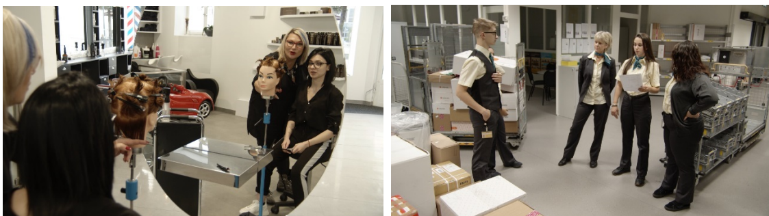
Bilder aus dem eigens von Katharine Dominicé für die Ausstellung gedrehten Film.

Die Herausforderungen der betrieblichen Berufsbildung werden anhand von drei Fragestellungen illustriert: die Vermittlung von Kompetenzen am Arbeitsplatz, das Spannungsfeld zwischen Produktions- und Ausbildungsaufgaben sowie das Zeitmanagement. Ein Film widerspiegelt die Übermittlung im Betrieb und ein Videospiele erlaubt, den Zeitdruck direkt spürbar zu machen.