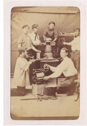
Atelier de serrurerie avec apprentis, 1865 – 1870

Rappel de l'importance du système de formation professionnelle dual, de son ancrage historique et de son implantation dans la population suisse. Le dispositif – une sélection de photographies mises en scène dans un intérieur domestique – souligne la place qu'a l'apprentissage dans le quotidien helvétique et pour des générations successives.