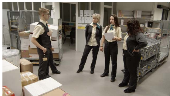
Images tirées du film de Katharine Dominicé produit spécialement pour l'exposition