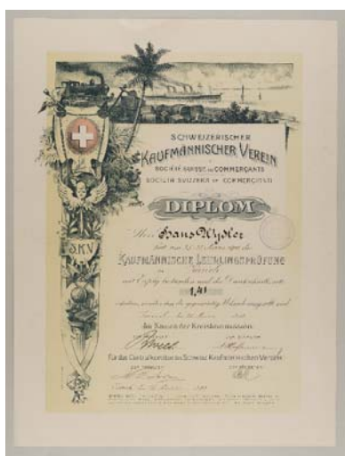
Diplôme pour l'examen d'apprentissage, 1912

La foison de diplômes montre, dans un contexte de fête, l'enjeu de la formation pour les apprenti-e-s, mais aussi pour les personnes qui les forment. L'obtention du CFC est une réussite et marque le passage d'apprenti-e à professionnel-le. La juxtaposition des diplômes raconte quelques histoires : parcours complets en formation professionnelle, mobilité sociale, familles de diplômé-e-s de la formation professionnelle, parcours pionniers.